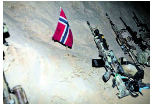
HEDRET: Bare timer etter at de blir drept, stiller medsoldater opp våpnene og hjelmen til de fire KJK-soldatene ved åstedet, som en stille markering. Det norske flagget, som har fått hard medfart i veibombeangrepet, valet på toppen av kjøretøyet deres.

På grunn av mye stov, holder de en del avstand. Med syv biler følger, strekker den lille kolonnen seg over 2-300 meter. – Noen slo av en vits på sambandet. Alt opp i førersetet på Ivecoen. Bak rattet sitter